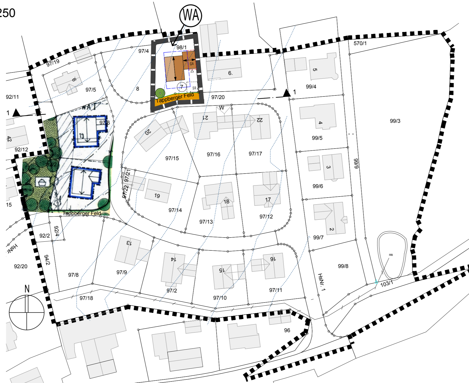
Lageplan M 1:1000 - 2.Änderung